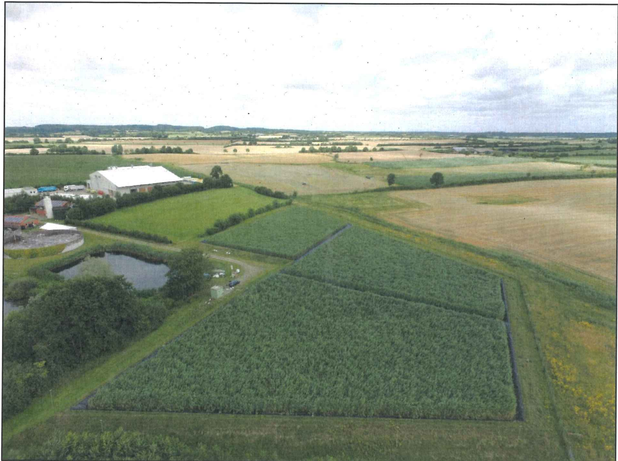
Abbildung 1: Übersichtsfoto per Drohne vom 27.07.2022