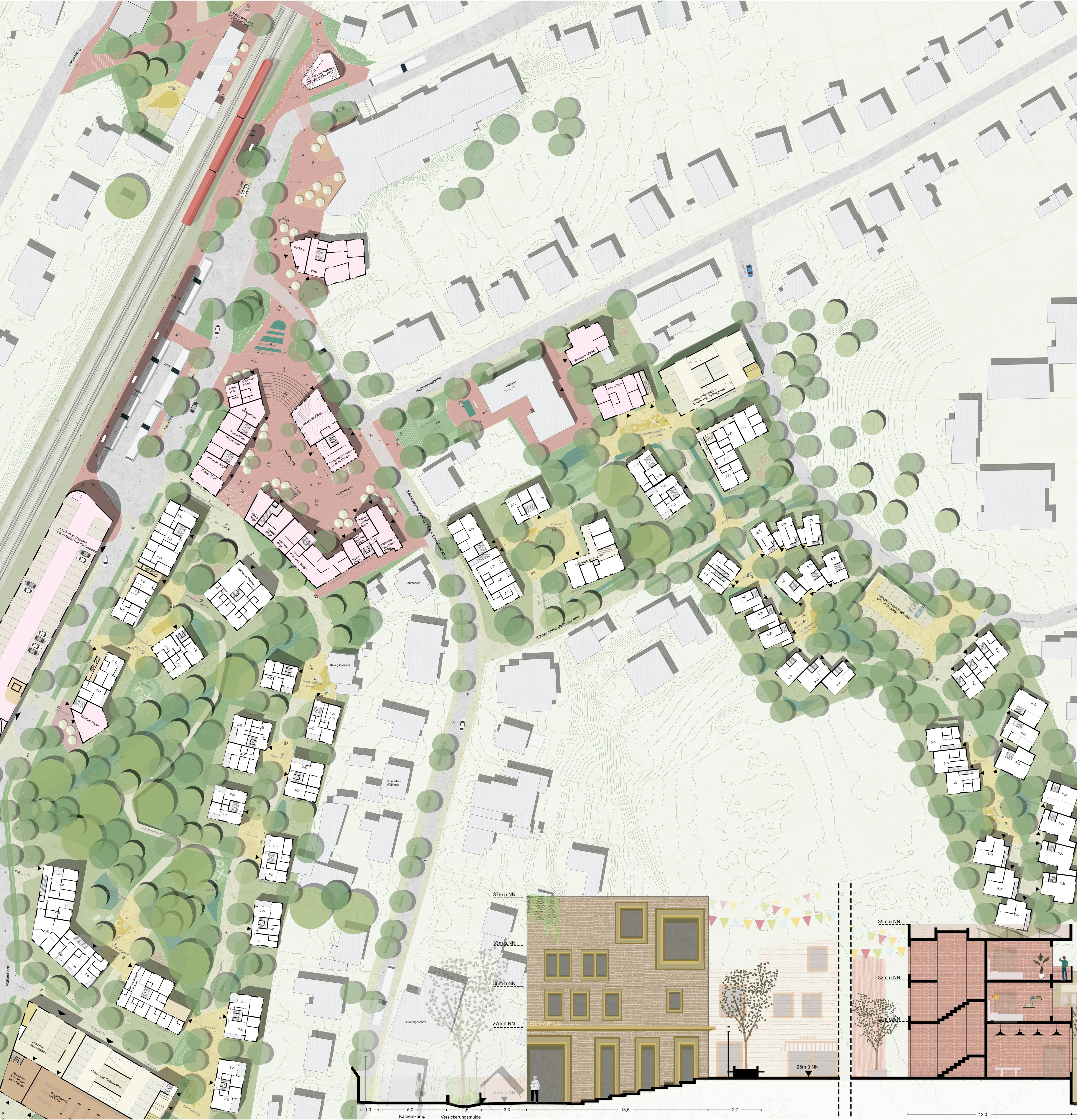
Städtebaulicher Funktionsplan M 1:500