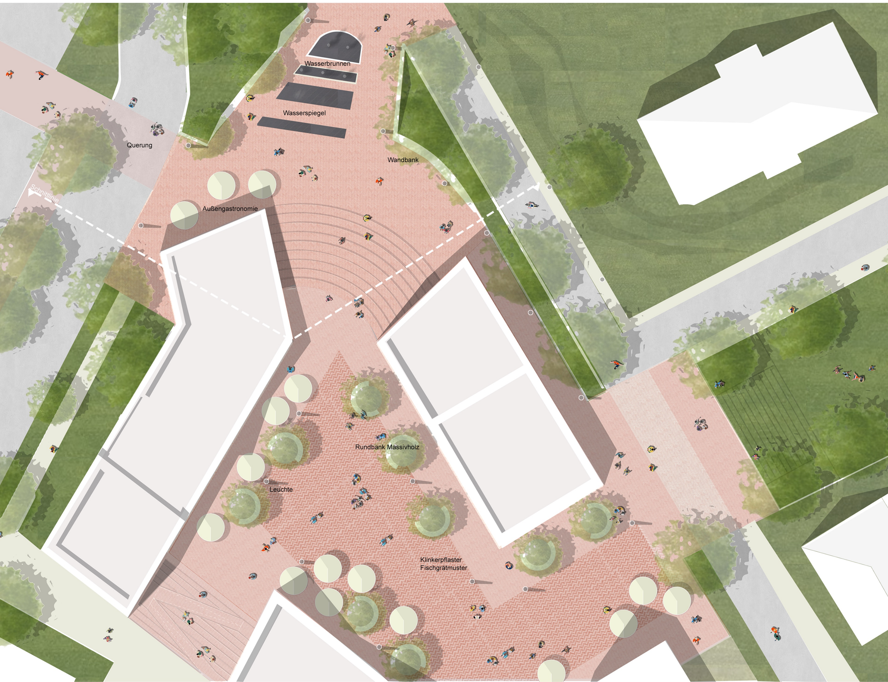
Platzgestaltung M 1:250