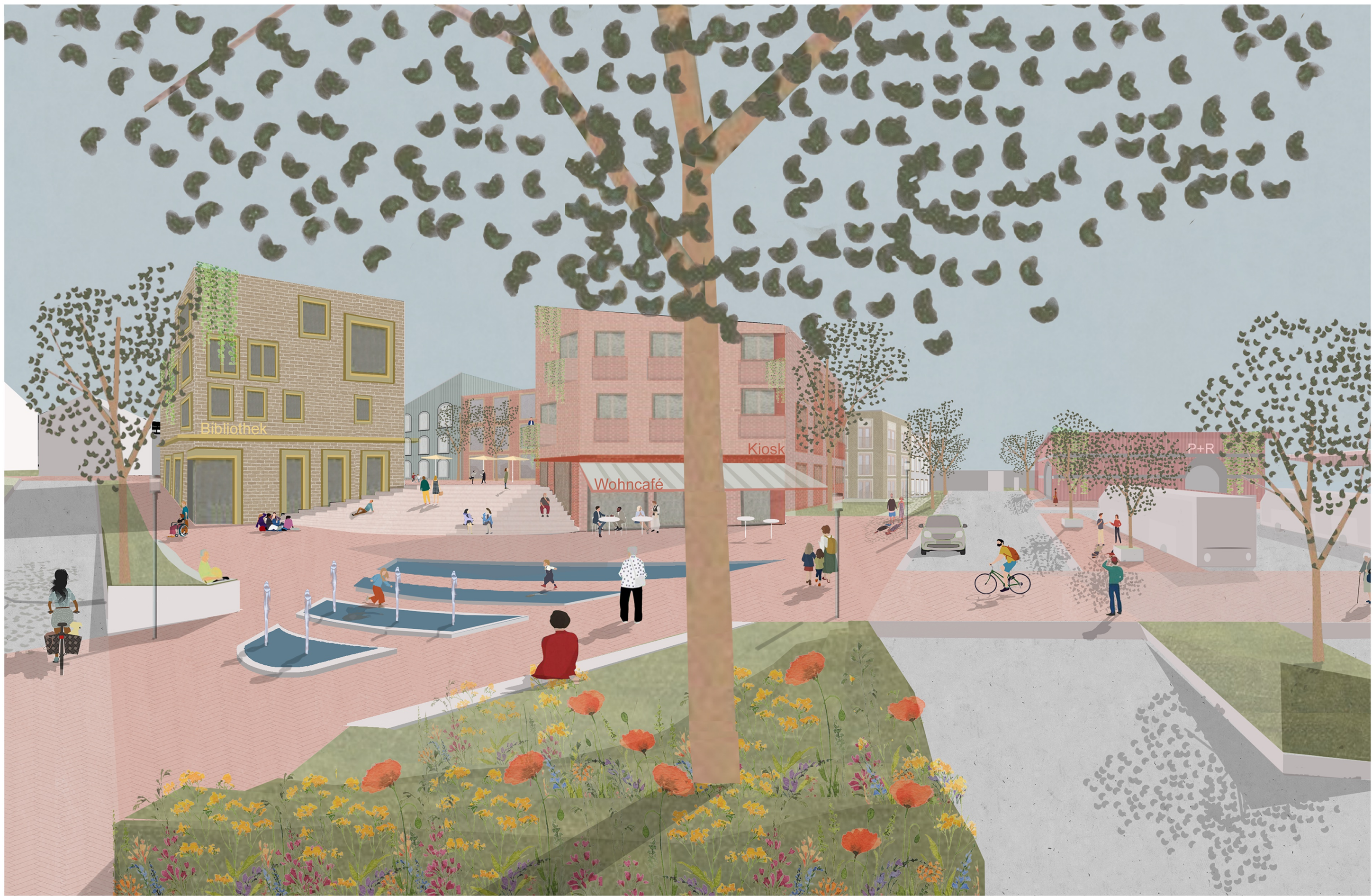
Blick ins neue Zentrum