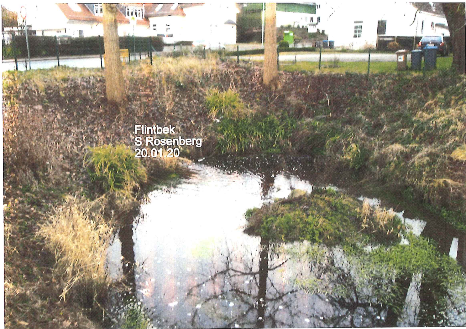
Flintbek S Rosenberg 20.01.20