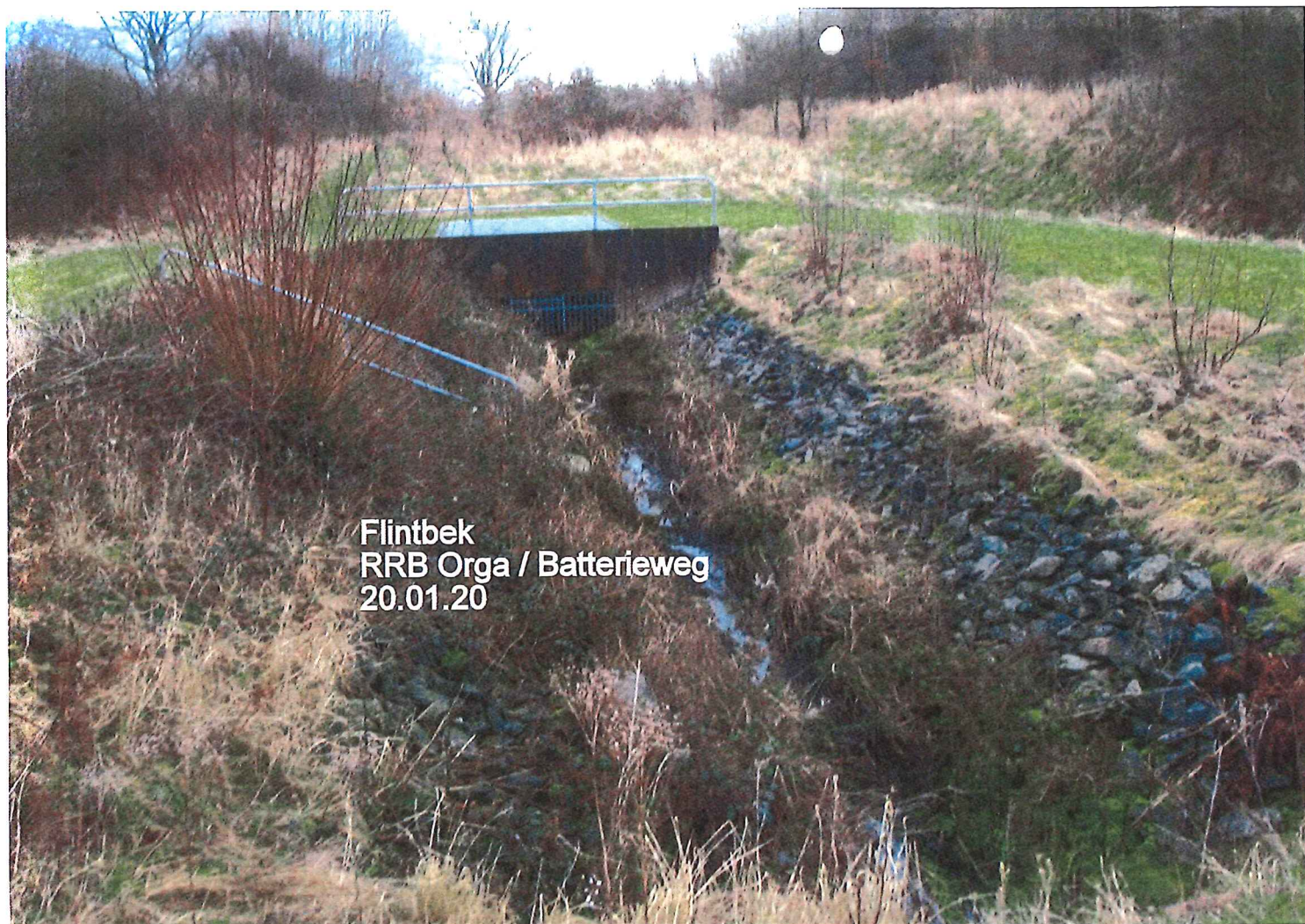
Flintbek RRB Orga / Batterieweg 20.01.20