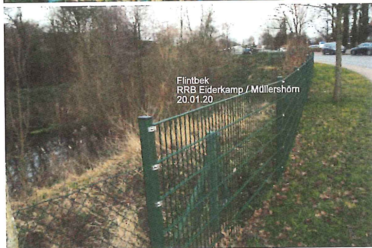
Flintbek RRB Eiderkamp / Müllershörn 20.01.20